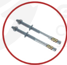
Pernos de anclaje de 1/2 x 7"